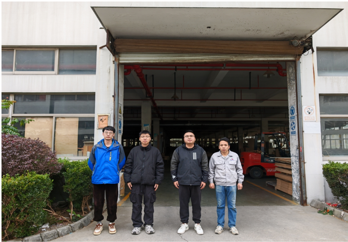
HONOR Magic7 Pro

24mm f/2 1/140s ISO50 2025/12/10 14:57 湖州市南浔区