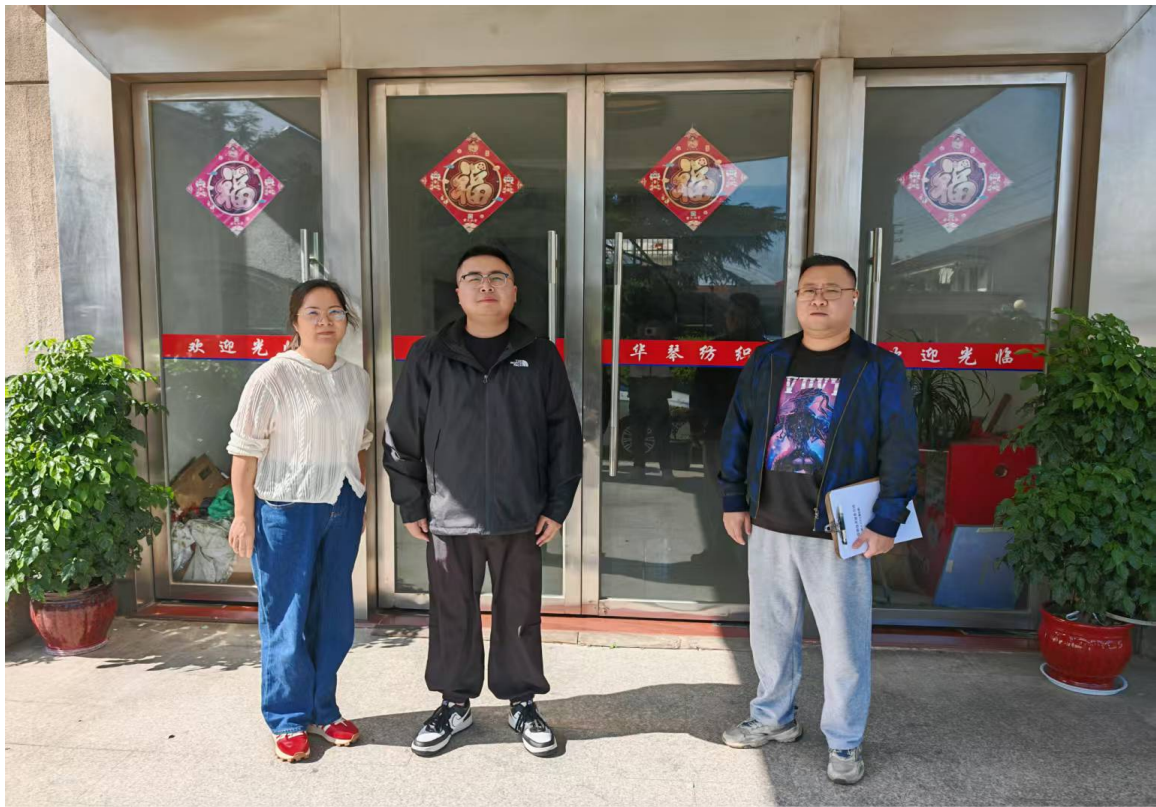
HONOR Magic7 Pro

24mm f/2 1/880s ISO50 2025/10/23 10:14 湖州市南浔区