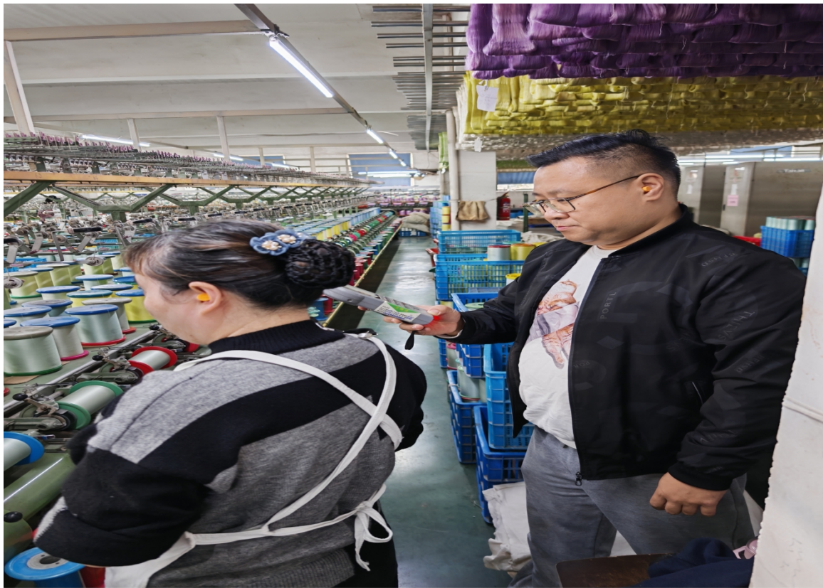
HONOR Magic7 Pro

24mm f/1.4 1/33s ISO320 2025/10/27 09:54 湖州市吴兴区